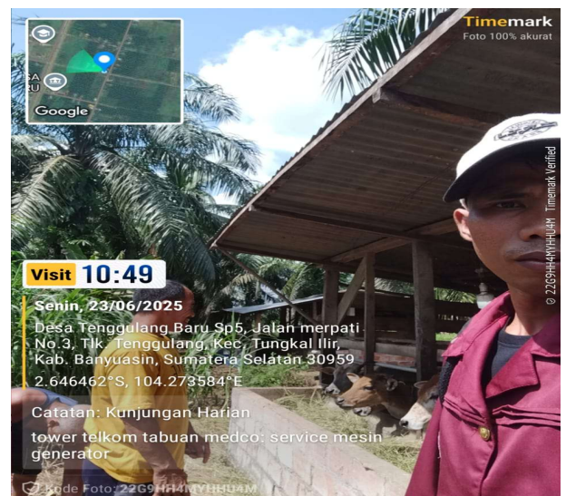
Gambar ; Wawancara dengan peternak Desa Tenggulang Baru