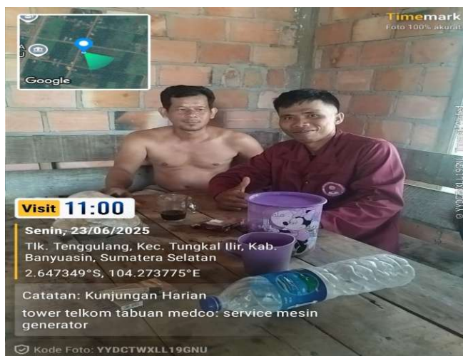
Gambar ; Wawancara dengan warga Desa Tenggulang Baru

Warga Desa Tenggulang Baru merupakan masyarakat extranmigrasi yang menjadi desa definitif pada tahun 2006 dan ditempatkan di wilayah kabupaten Musi Banyuasin kecamatan Sungai lili pada tahun 1999 dan ikut pemekaran kecamatan pada tahun 2010 menjadi salah satu desa di wilayah kecamatan Babat supat kabupaten Musi Banyuasin. Perekonomian Masyarakat Desa Tenggulang Baru di tunjang oleh komoditas Perkebunan Sawit Pribadi, sektor perkebunan masyarakat desa merupakan hal yang cocok bagi pengembangan dalam hal peternakan khususnya peternakan sapi pedaging, adapun demikian hanya beberapa warga masyarakat desa yang bergerak dalam bidang peternakan sapi untuk menunjang perekonomian. Setelah dianalisa melalui wawancara dengan beberapa warga Desa Tenggulang Baru bahwasanya banyak warga Desa Tenggulang Baru yang berminat untuk bisa beternak sapi akan tetapi terbentur pada permasalahan dalam permodalan, untuk dapat melakukan beternak sapi diperlukan permodalan yang cukup besar.